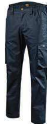
col.60062 classic navy

Pantalone cargo, tasche laterali, dettagli rifrangenti, elastico in vita, tripla cucitura. Cintura sagomata per un maggior confort.