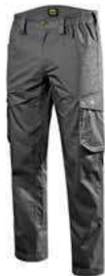
col.75070 steel grey