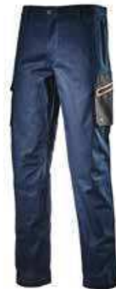
col.60062 classic navy

Pantalone cargo in cotone canvas elasticizzato, tasca laterale zippata con dettaglio termonastrato rosso e tasche mani zippate in poliestere Oxford resistente all'abrasione. Elastico in vita, tasche laterali capienti, tripla cucitura.