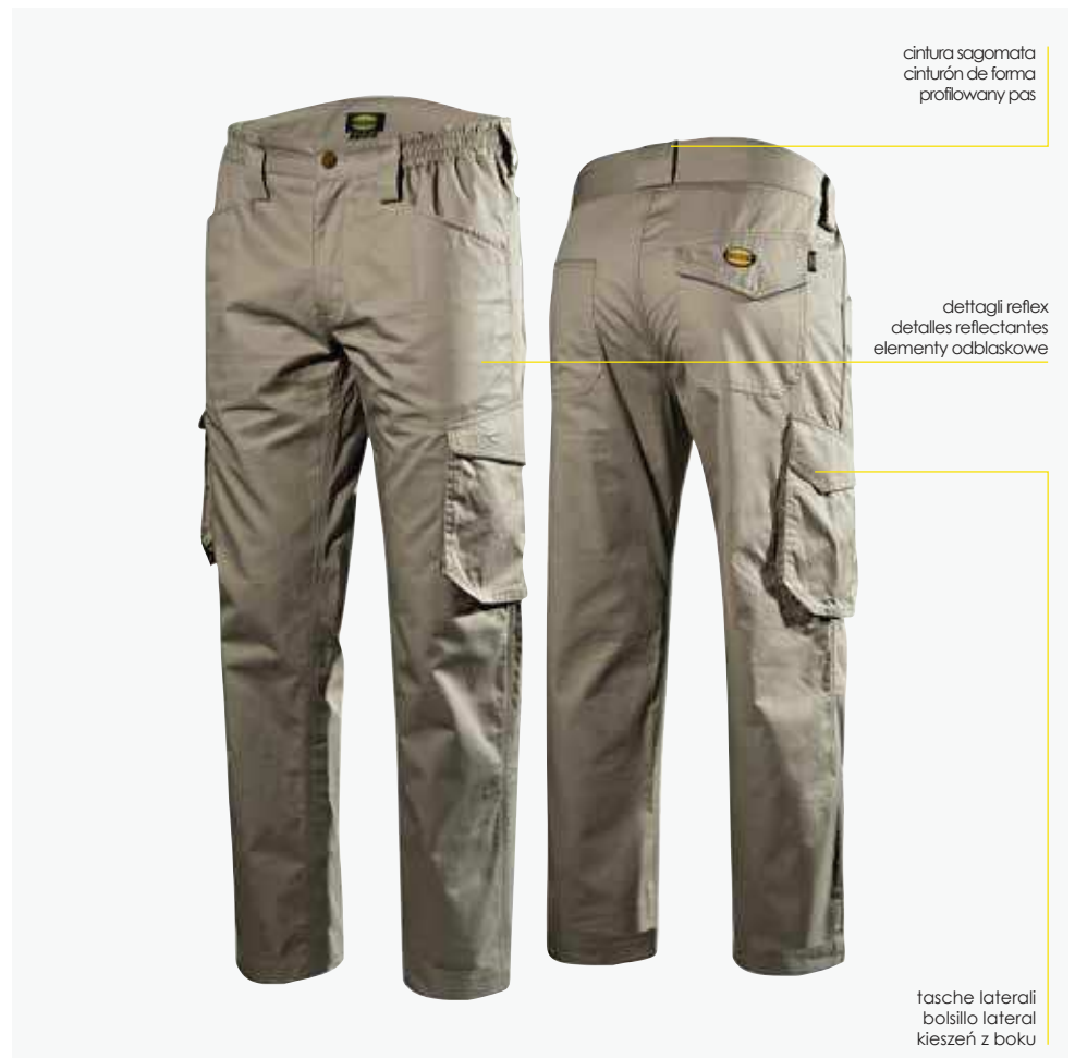
col.75012 grey hemp