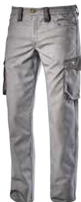
col.75070 steel grey