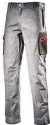
col.75047 rain grey