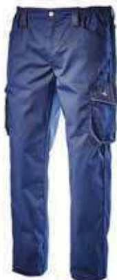
col.60062 classic navy

Pantalone cargo invernale, tasca laterale, dettagli rifrangenti, tasche laterali capienti e dettagli in contrasto in materiale anti abrasivo, elastico in vita, tripla cucitura.