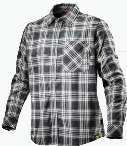
col.C7266 black/off white

Soffietto sul retro fuelle detrás wstawka na plecach