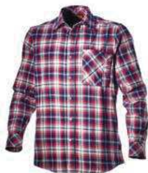
col.C6533 blue corsair/star white/red