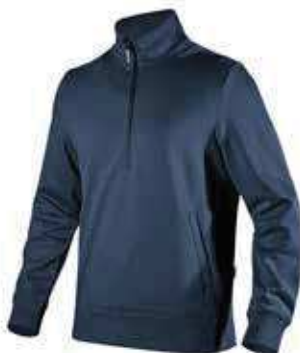
col.60062 classic navy