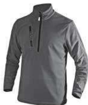
col.75070 steel grey

Maglia mezza zip in micro pile con taschino frontale con zip. Fondo e polsini manica elasticizzati con Lycra.