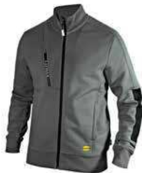
col.75070 steel grey

Felpa full zip garzata con inserti laterali neri su maniche e fianchi. Due tasche aperte laterali e una tasca frontale con zip. Collo, polsini e fondo in costina elasticizzata.