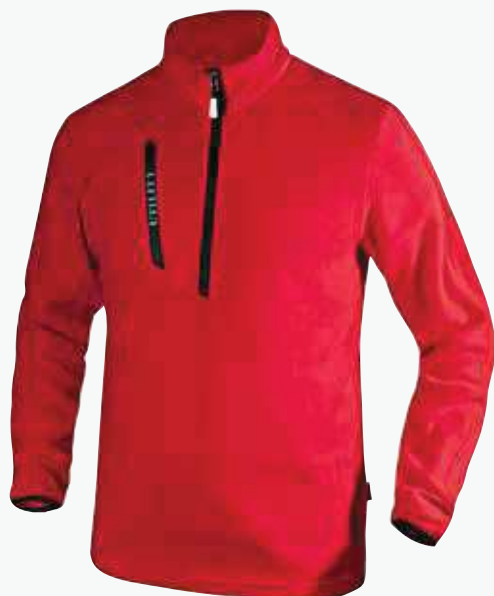
col.45045 true red