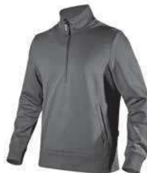
col.75070 steel grey

Felpe mezza zip in poliestere e cotone, garzata. Due tasche aperte laterali. Collo, polsini e fondo in costina elasticizzata. Tessuto testato per lavaggi industriali secondo ISO 15797