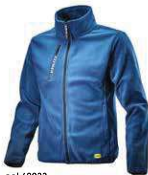
col.60033 blue dark denim