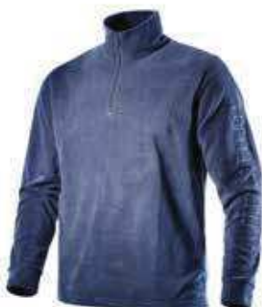
col.60030 einsign blue