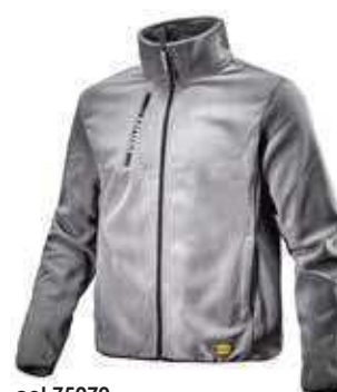
col.75070 steel grey

Pile full zip con doppia garzatura. Taschino al petto con wording Utility, tasche mani, fondo e polsini in materiale elastico.