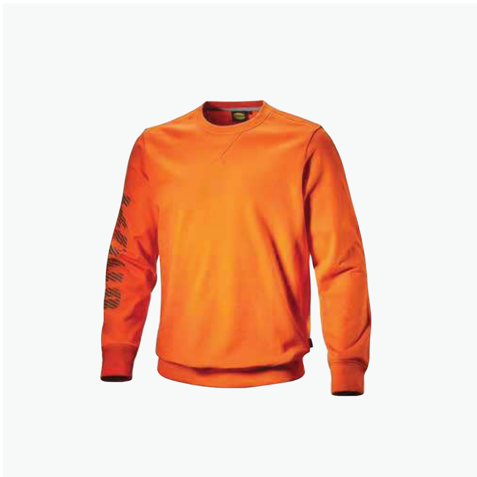
col.40052 vermillion orange