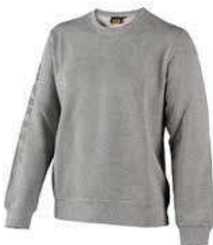
col.C5493 light middle grey melange