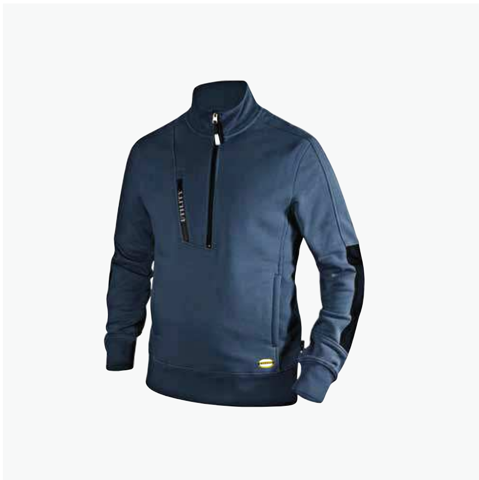
col.60062 classic navy

Bluza szczotkowana, 80% bawełna, 20% poliester, 280 gr/m 2 ; Kontrastowe wstawki: 100% poliester