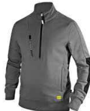
col.75070 steel grey

Felpa con zip garzata con inserti laterali neri su maniche e fianchi. Due tasche aperte laterali e una tasca frontale con zip. Collo, polsini e fondo in costina elasticizzata.