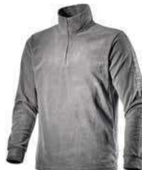
col.75070 steel grey

Maglia mezza zip in micro pile con stampa Utility su manica.