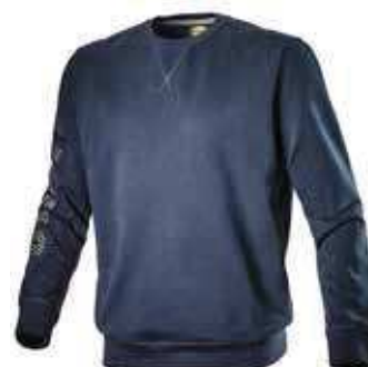
col.60063 blue corsair

Felpa girocollo in cotone di alta qualità non garzata, stampa effetto metallico Utility su manica destra.