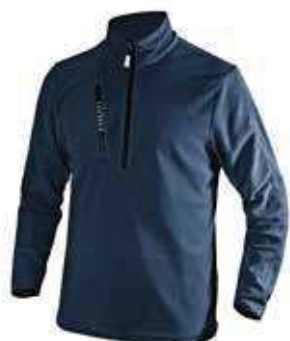
col.60062 classic navy