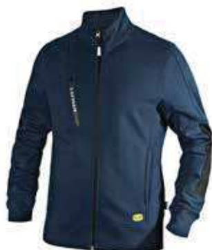
col.60062 classic navy