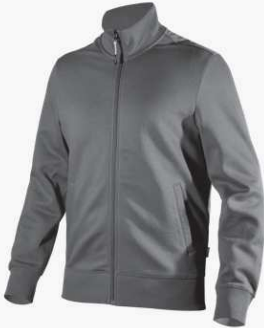
col.75070 steel grey