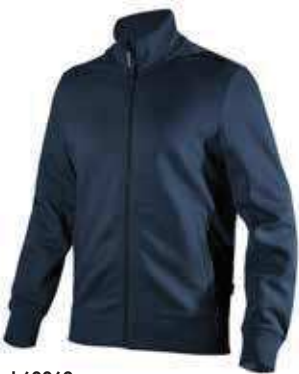
col.60062 classic navy